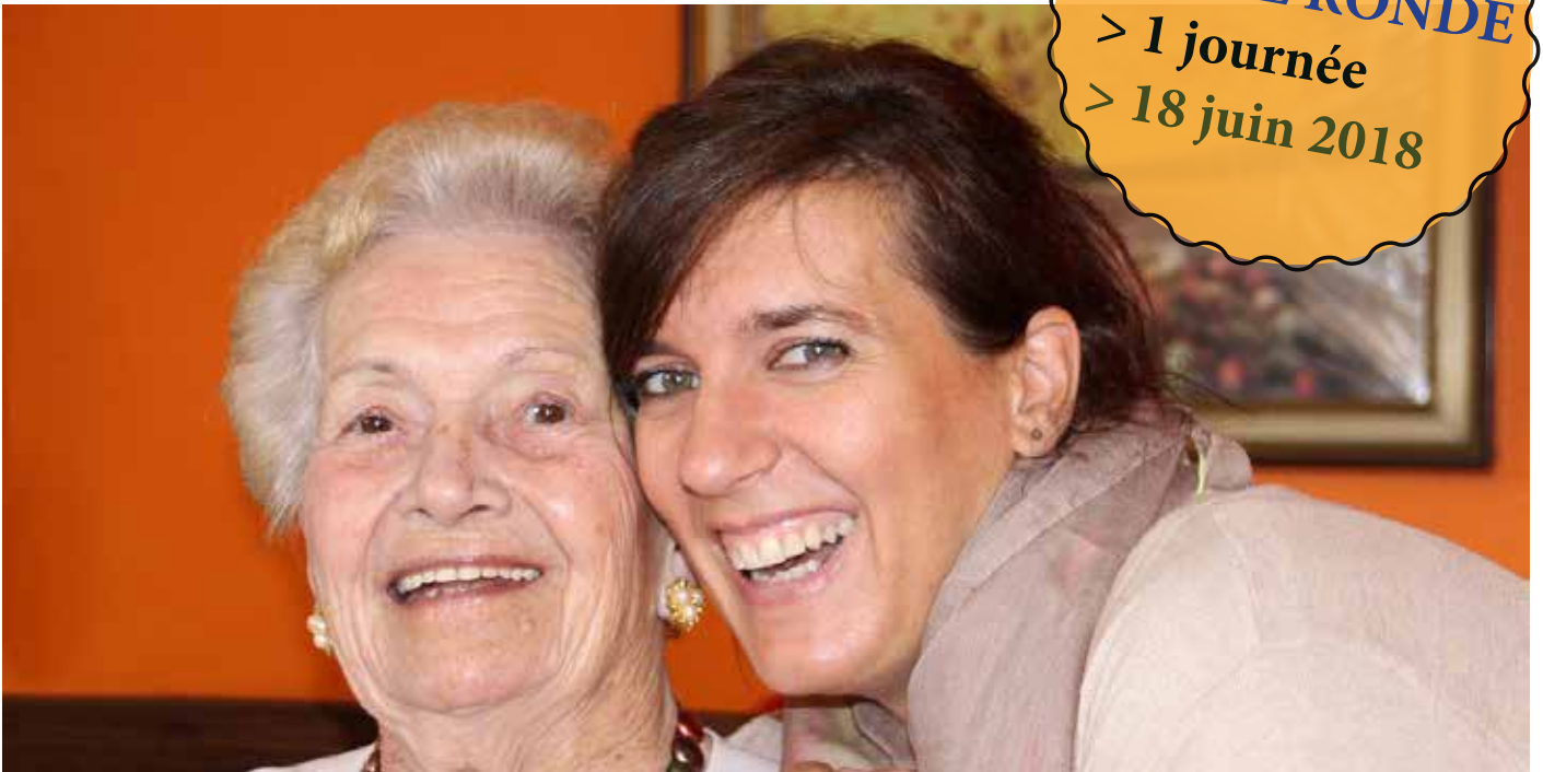
TABLE RONDE > 1 journée > 18 juin 2018